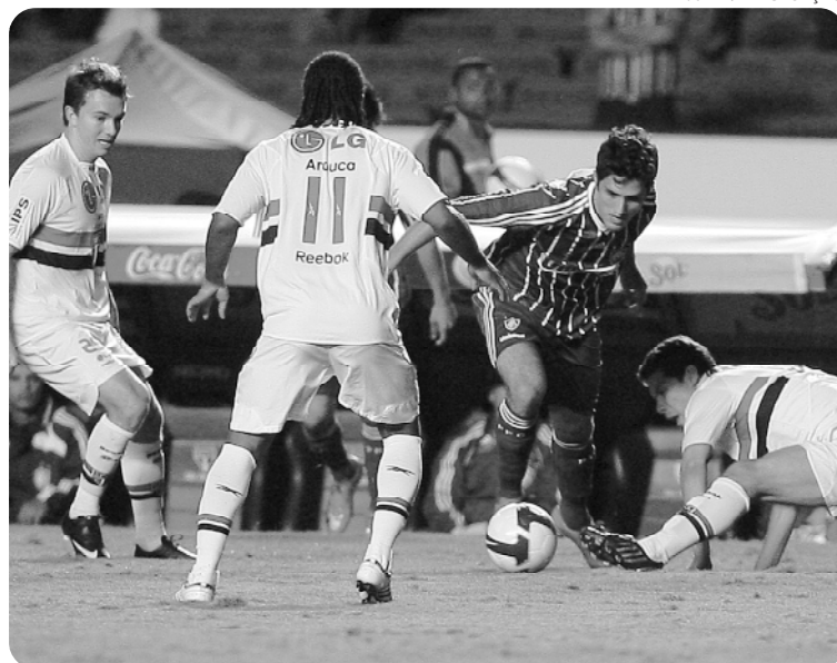
O São Paulo foi muito superior ao Fluminense durante toda a partida

O meio-campista Hernanes reforçou as declarações do treinador e exaltou a arrancada do clube depois do período turbulento. "O São Paulo se recuperou e estamos na briga. Nós lutamos, sofremos e agora estamos no páreo".