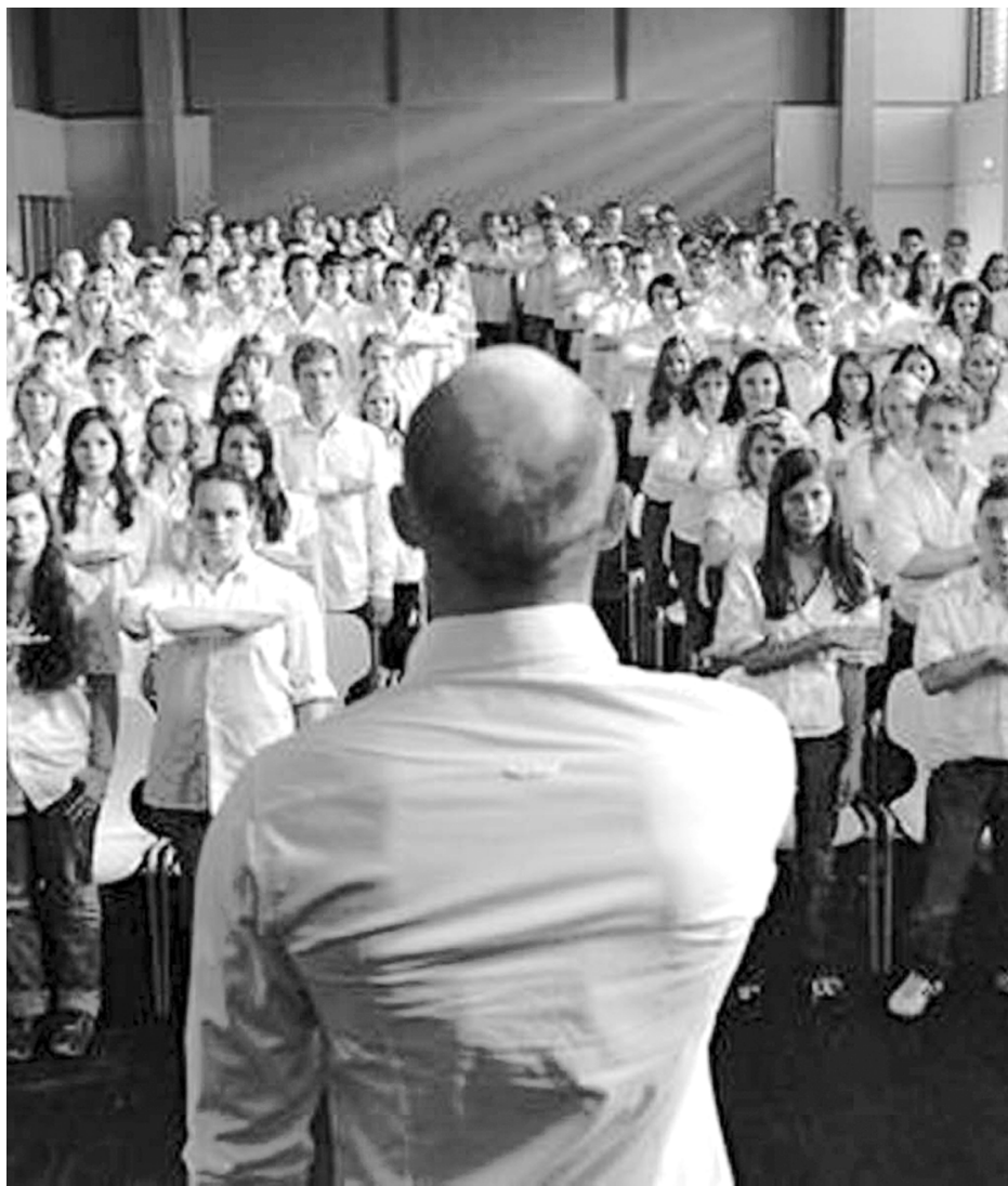
Fruto do novo cinema alemão, 'A onda' é um alerta sobre a retomada do nazismo

"A revista Coquetel é muito legal! Além de ser um ótimo passatempo, você se diverte e desenvolve o lado intelectual."