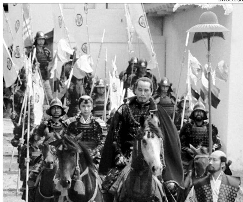
Cena de 'Kagemusha', filme que reúne drama e guerra, na ótica de Kurosawa

Ele pede que considerem isto como seu testamento. Seus exércitos abandonam o cerco e, enquanto retornavam, Shingen vê Kyoto e morre. Assim seu desejo é mantido e, para que seus inimigos não ataquem e as tropas se mantenham motivadas, seu sócia devidamente treinado