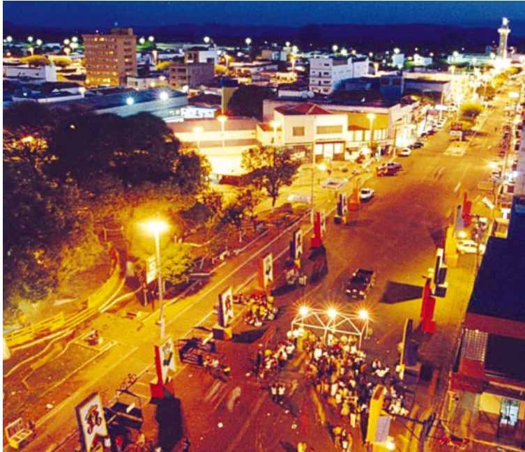
A cidade de Patos foi uma das mais atingidas pelas chuvas deste ano

Os recursos serão aplicados para recuperação de nove açudes, 11 escolas, 208 quilômetros de rodovias, 166 unidades re-