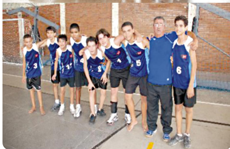
Colégio Polígono, acima, e Escola Estadual Liberdade decidem o título