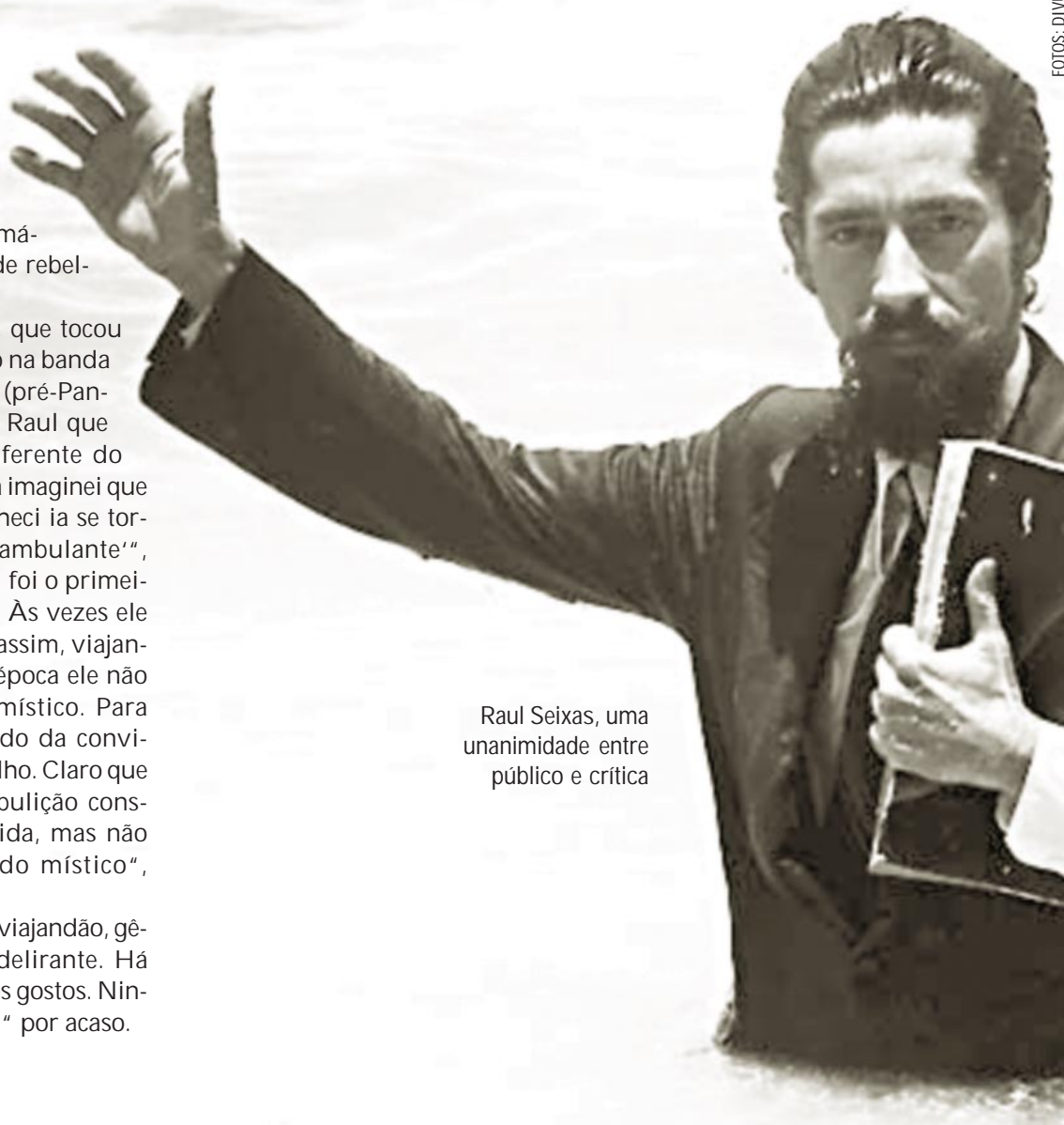
Raul Seixas, uma unanimidade entre público e crítica